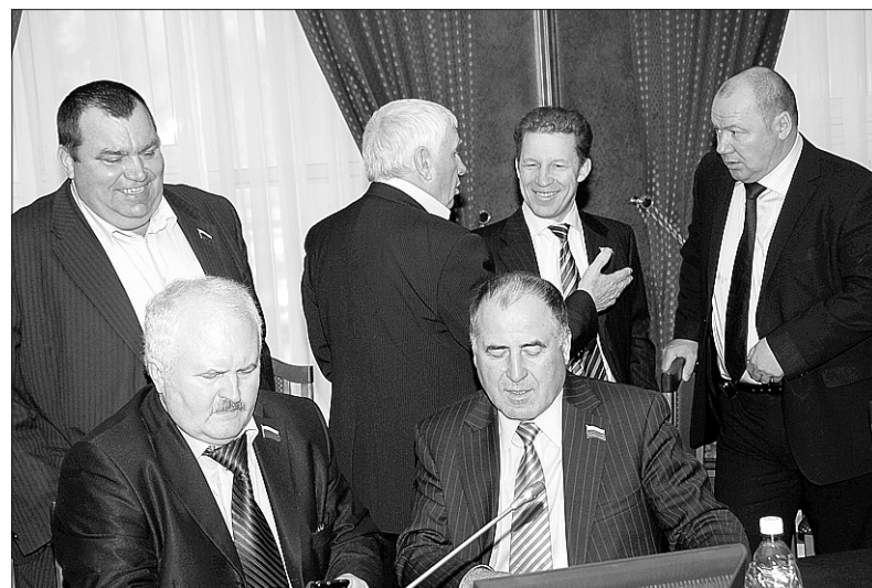
Аграрии считают, что жильё надо строить не только в райцентрах, но и в сёлах.