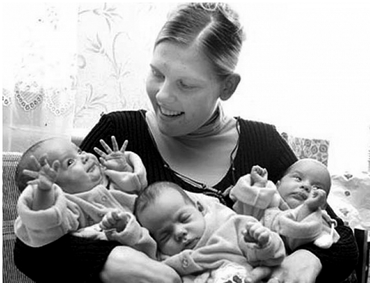
В Новосибирской области сегодня проживает 14 859 многодетных семей (из них приёмных — около 500). В них воспитывается 49 658 детей.

В соответствии с областным законом ещё с 2003 года многодетные семьи имеют право на бесплатное однократное предоставление в собственность земельных участков из земель, находящихся в государственной или муниципальной соб-