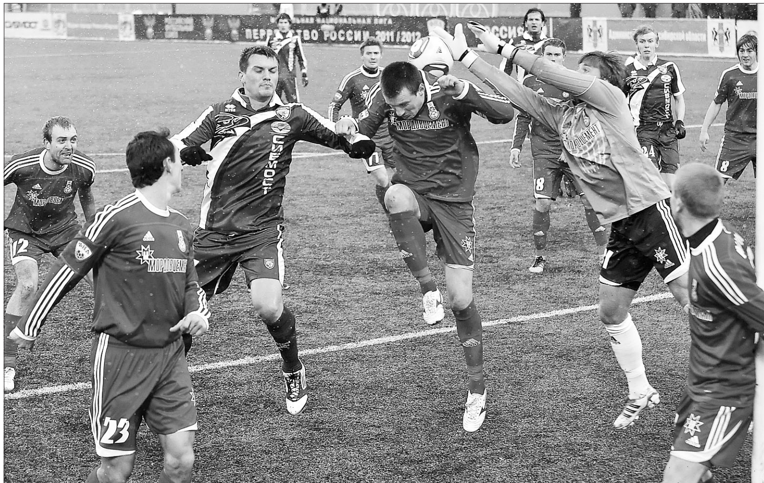
В штрафной площадке «Мордовии» обе команды схватывались «стенка на стенку».