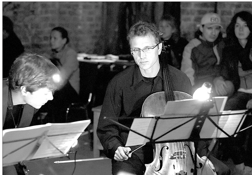
ГАМ-ансамбль создан в 2010 году в Москве композитором Олегом Пайбердиным.